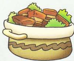
hóng shāo ròu 红 烧 肉