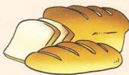
miàn bāo 面 包