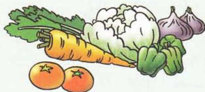
shū cài 蔬 菜